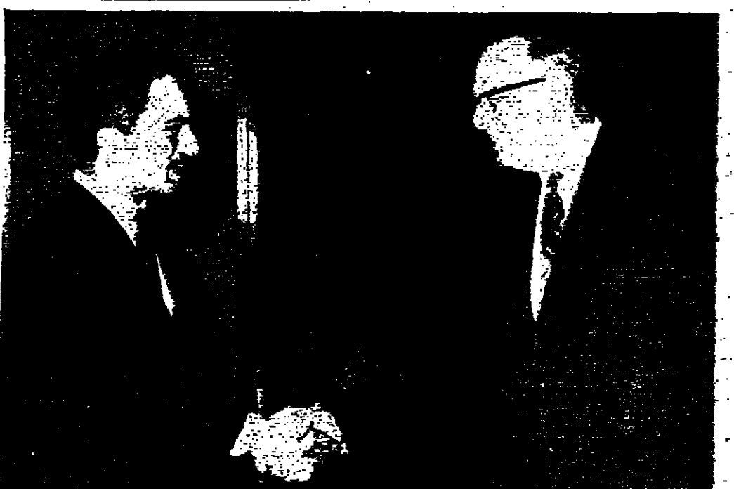
عائلة الملك المعظم يصطحب المستر كركوود رئيس الجامعة الامريكية في بيروت وتشره بالقبلة لتصوير و.ا.ا.

القاهرة - اجتمع السيد صلاح جوهري وكيل وزارة الخارجية في الجمهورية العربية المتحدة بالسيد عادل الشمالية سفير الاردن بالقاهرة وبحثا تطورات الموقف في الشرق الأوسط ومهمة الدكتور فونسترايغ المبعوث الدولي للشرق الأوسط ونتائج المحادثات التي اجراها في القاهرة أثناء زيارته الاخيرة لها .